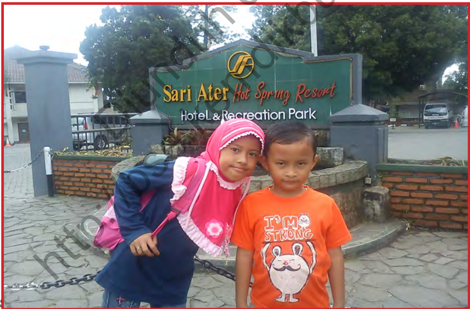
Gambar 4.10 Tempat rekreasi dan bermain keluarga di suatu wilayah kota atau kabupaten menjadi sumber pendapatan daerah yang sah. Hasilnya pun dirasakan oleh masyarakat di wilayah tersebut.

Pemerintah daerah dapat melakukan pinjaman yang berasal dari penerusan